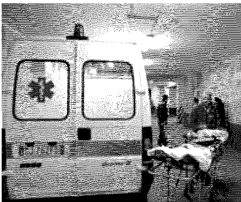
Ambulanza in sosta all'interno del nosocomio