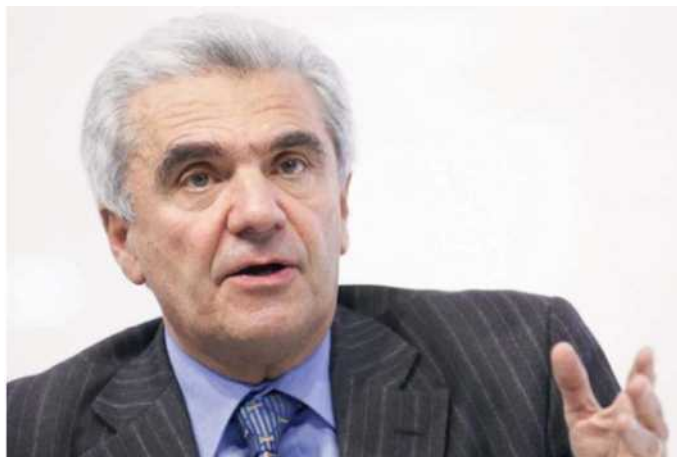
Ministro della Salute. Renato Balduzzi