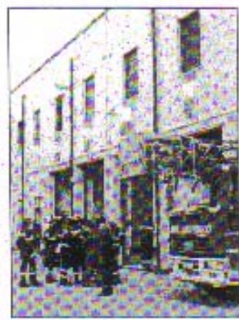
Vigili del Fuoco

di carenze organizzative e la totale indifferenza delle istituzioni nei confronti delle legittime rivendicazioni dei lavoratori. In questi ultimi anni a fronte di un progressivo miglioramento degli Standard Operativi e di un notevole aumento delle specializzazioni e competenze del Corpo non è stato corrisposto ai lavoratori un benché minimo riconoscimento economico, né hanno trovato risposta le varie richieste di veder riconosciuto il proprio lavoro come usurante, di adeguamento retributivo ad altri corpi dello stato o di adeguamento di personale e di mezzi. I Vigili del Fuoco - è scritto nella nota - sono ormai stanchi delle numerose "Pacche sulle spalle" date dai politici di turno.