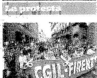
Un corteo Cgil

Testo in Senato, Cgil si mobilita "Una manovra contro i deboli"